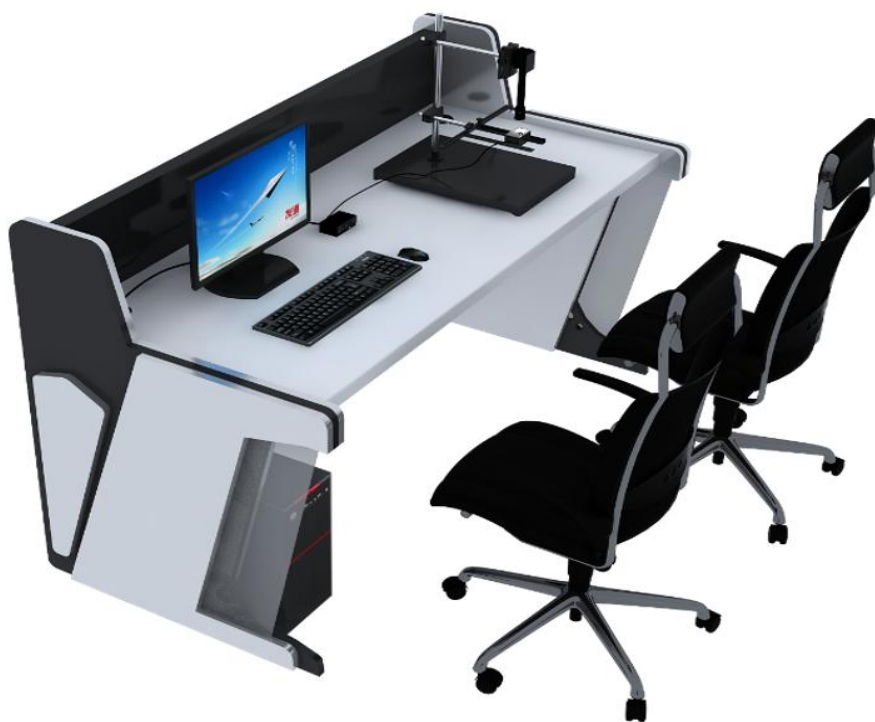
技术平台效果示意图

技术平台为一套人工智能深度学习实训、竞赛系统。包括人工智能服务器、数据集制作平台、模型训练平台、应用